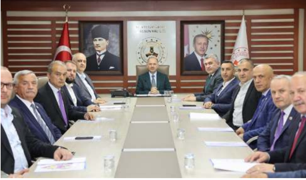
Giresun Valisi Mehmet Iğında Giresun 2. Organize Sanayi Bölgesi Mütebbis Heyet Toplantısı düzenlendi.

Toplantıda, organize sanayi bölgesinin gelişimi ve projeleri üzerine detaylı bir değerlendirme yapıldı. Son gelişmeler hakkında bilgi verildi.