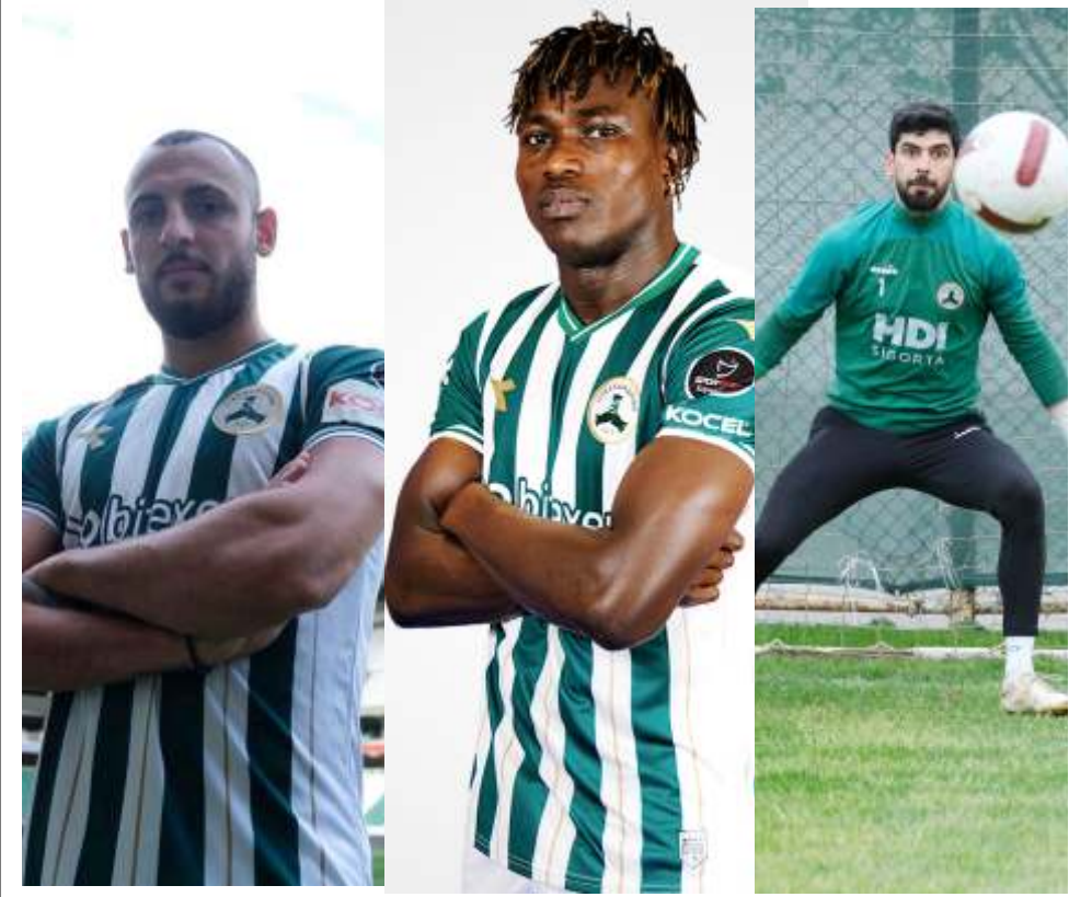
Giresunspor'da sözleşmesi bitecek üç oyuncu be- lirlendi ve bu oyuncularla yolların ayrılacağı bildirildi. Ancak, takımın bu sezonki kötü performansı ve alt lige

düşmesi nedeniyle, önümüzdeki sezon için nasıl bir yol haritası izleneceği belirsizliğini koruyor.