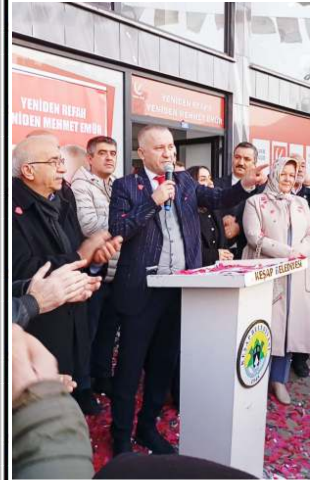
Keşap Belediye Başkanı ve Yeniden Refah Partisi Adayı Mehmet Emür, Keşap'ta seçim bürosunun açılışını yaptı.

Emür'ün yoğun bir katılımıyla gerçekleşen miting gibi açılışı Keşap Belediye binasından başlayarak kalabalıkla birlikte yürüyüş gerçekleştirdi.