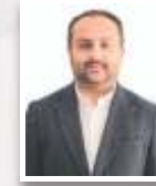
ONUR KONAR CUMHURİYET HALK PARTİSİ