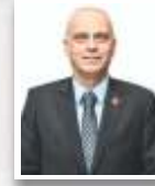
AHMET VAHDET YENAL CUMHURİYET HALK PARTİSİ