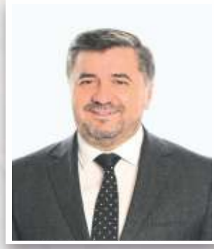
AYTEKİN ŞENLİKOĞLU GİRESUN BELEDİYE BAŞKANI