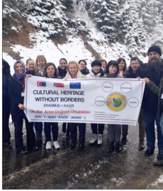
Samında Giresunlu öğretmen ve öğrencileri ülkelerine davet ederek şehirden ayrıldılar.

Sıcak ilgi, adaka ve misafirperverlikten memnun olduklarını dile getiren konuklar, her yönüyle Giresun'a hayran kaldıklarını belirterek ilk fırsatta tekrar gelmek istediklerini söylediler. Güre Ortaokulu yöneticilerine, proje koordinatörüne ve öğretmenlerine teşekkür eden konuklar proje kap-