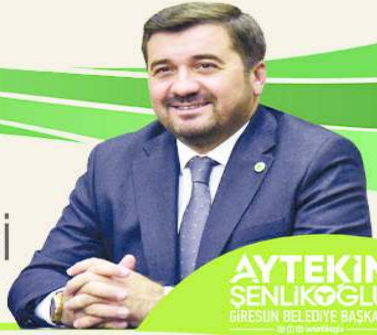
AYTEKİN ŞENLİKOĞLU GİRESUN BELEDİYE BAŞKANI