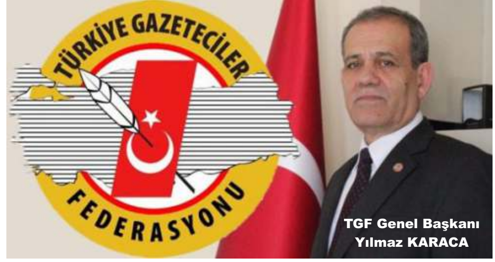
TGF Genel Başkanı Yılmaz KARACA

ya da basın kartlarını yenileyecek arkadaşlarımızın kartlarının verilmesinin gecikmesi bir an önce düzene sokulmalıdır. Tüm dünyada olduğu gibi ülkemizde de basın kartlarının yetkilendirilecek bir Basın Meslek Örgütü tarafından verilmesi sağlanmalıdır.