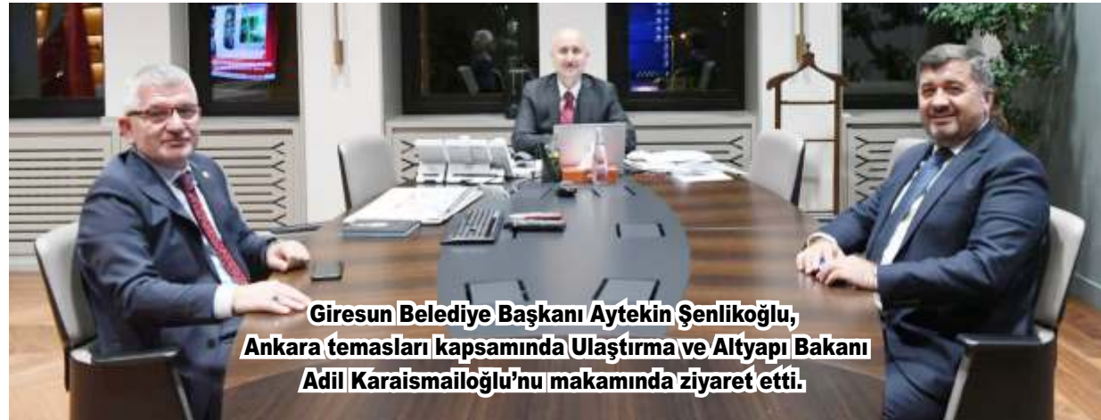
Giresun Belediye Başkanı Aytekin Şenlikoğlu, Ankara temaları kapsamında Ulaştırma ve Altyapı Bakanı Adil Karaismaioğlu'nu makamında ziyaret etti.

Belediyenin yaptığı ve yapacağı çalışmalar hakkında bilgi veren Başkan Şenlikoğlu, Bakan Karaismaioğlu ile önemli bir görüşme gerçekleştirdi.