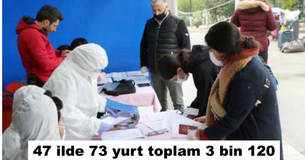
47 ilde 73 yurt toplam 3 bin 120 sağlık personeline ev sahipliği yapıyor

Bakan Kasapoğlu, bakanlık yurtlarında 14 günlük gözlem ve izleme sürelerini geçiren vatandaşların her türlü ihtiyaçlarının karşılandığını da ifade etti. Karantina kapsamında hizmet veren bakanlık yurtlarında; tüm odaların düzenli olarak dezenfekte edildiğini, her odaya özel kişisel temizlik ve hijyen malzemeleri bırakıldığını belirten Bakan Kasapoğlu, görevlilerin ise maske, gözlük ve tulum giyerek odalara girdiğini söyledi. Odalarda kalan vatandaşların yemek, su, çay, ilaç vb. tüm ihtiyaçlarının kapıdan servis edildiğini belirten Bakan Kasapoğlu, "Üç öğün yemek, çay ve meyveler sürekli odalara servis edilmekte; misafirlerimizin koridorlara çıkmalarına izin verilmemektedir" dedi.